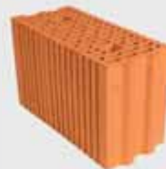
POROTHERM 17,5 P+D