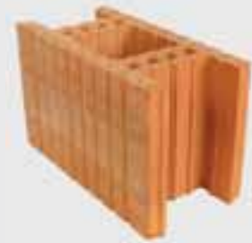
POROTHERM Profi 20 Akustik